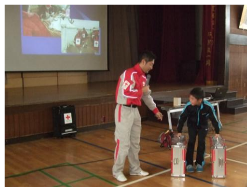
<東日本大震災活動体験談講話>