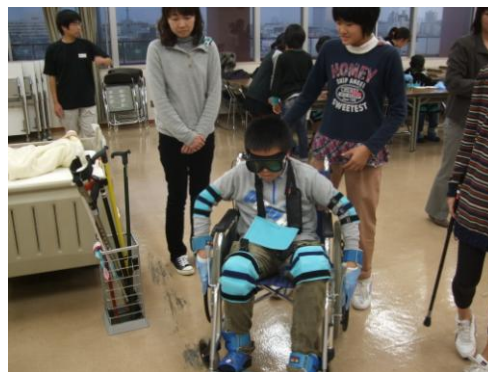
<高齢者疑似体験・車椅子体験>

※所要時間・プログラム内容など、 お気軽にご相談下さい。 ※講師派遣費用は無料です。