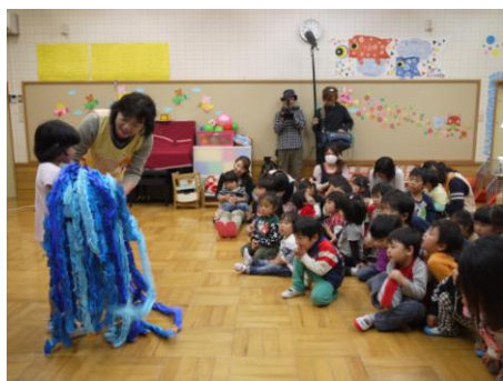
<上越市立国府小学校からの折り鶴>