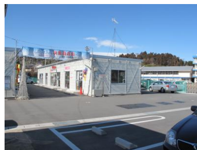
<小学校の敷地内にできた復興商店街>