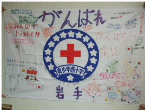
<上越地区トレセンにて作成>