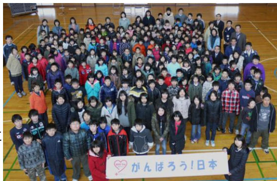
長岡市立川口小学校より、東日本大震災で被災された方への応援メッセージ

また、中越大震災で被害のあった川口小学校のみなさんにもご協力をいただきました。ありがとうございました。