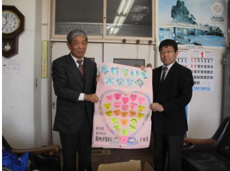
<長岡市立表町小学校より>

東日本大震災発生直後から、県内でも多くの青少年赤十字加盟校から義援金の募金活動に協力していただきました。そして「他に自分たちに何かできることはないか。」と児童たちが考えて色々な応援グッズを作成してくれました。被災されたみなさんに元気になってほしいという願いが込められた品は、各県支部を通して学校・避難所・病院などへお届けいたしました。