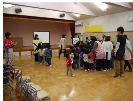
<防災〇×クイズの様子>