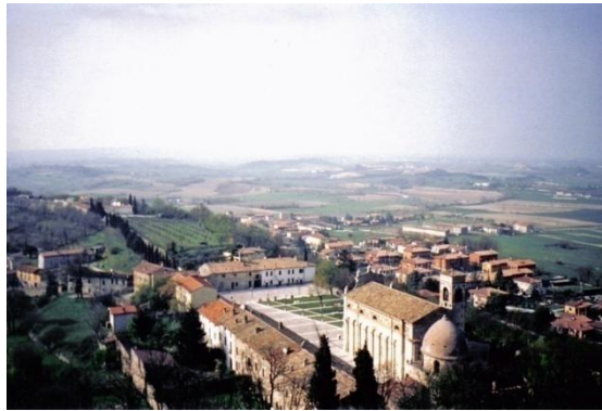
戦場となったソルフェリーノの丘