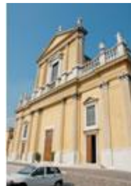
高い丘に建つマジョーレ教会